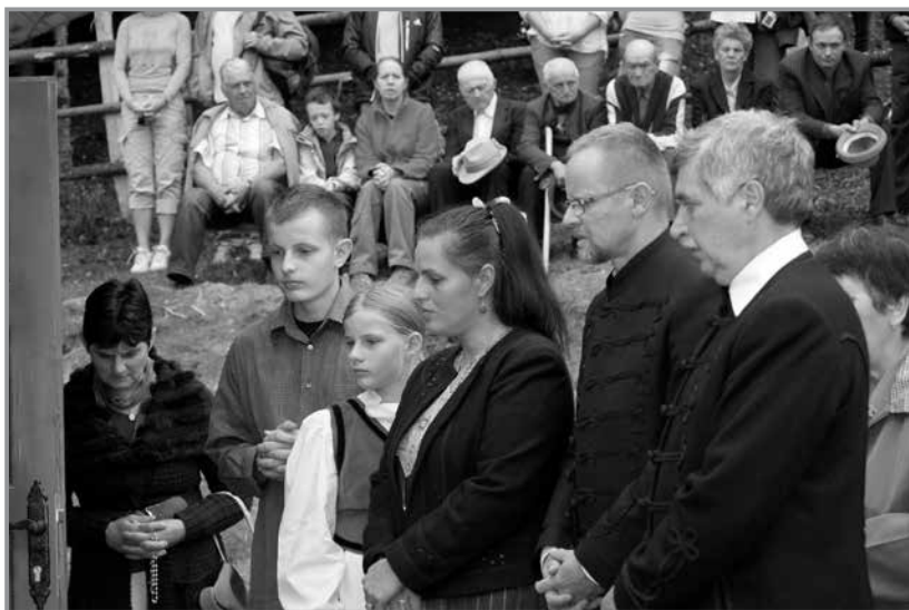
Kápolnaszentelés 2015. szeptember 26.

Az orvos azonnal teljeskörű vizsgálatot rendelt el, és szerencsére semmilyen ütést, zúzódást, belső vérzést nem találtak rajta, csak a homlokán volt némi horzsolás, bizonyára az aszfalttól. Sok