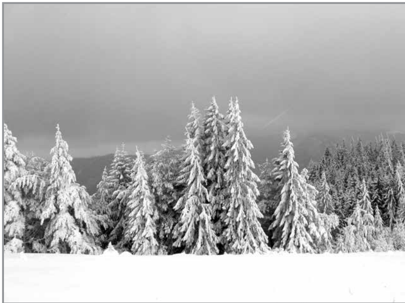
A Sajhavas télen

elfogadást és felebaráti szeretetet igényel. Ez egy olyan út, amelyen az élvezeteket nem az internet, a szirupos tévésorozatok meg a bulik nyújták, hanem a mindennapi kemény munka, a friss levegő, a ragyogó kék égbolt, a madarak csiripelése, a jókedvűen munkálkodó csángó férfiak, gyermekek és asszonyok látványa, a frissen sült kenyér és a felszántott Anyaföld illata, az istállóban vidáman hancurozó kecskék, a kiscsikókat váró Juci nevű kanca látványa.