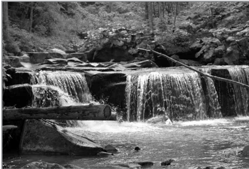
Vízesés a Baskán